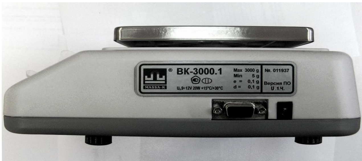
Рисунок 4 – Общий вид весов. Маркировка весов

Маркировка весов производится на фирменной, разрушающейся при снятии, пластине (Рис. 2), на которой нанесено: