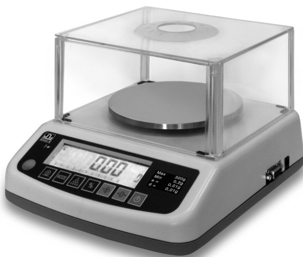
Рисунок 3 – Общий вид весов