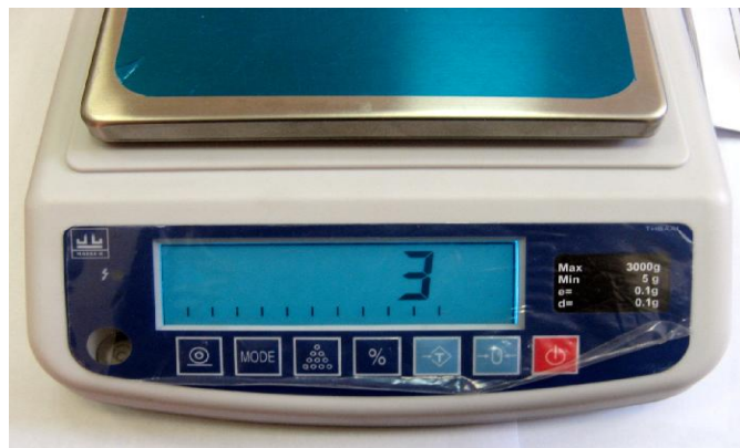
Рисунок 1 - Индикация кода юстировки