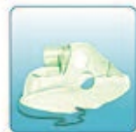
Респираторная маска для взрослых – 1 шт.