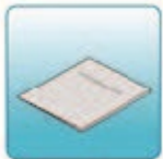
Руководство по эксплуатации (на русском языке) и гарантийная карта – 1 шт.