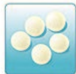
Воздушный фильтр – 5 шт.