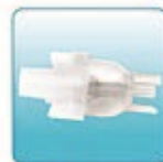
Емкость для лекарства – 1 шт.