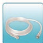
Соединительная трубка – 1 шт.