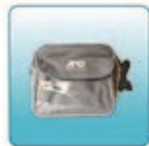
Кейс для хранения и переноски – 1 шт.