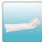
Насадка для рта – 1 шт.