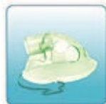
Респираторная маска для детей – 1 шт.