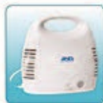
Основной блок в корпусе – 1 шт.