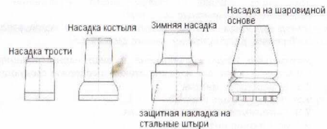
Рис. 1 Виды насадок

Внимание: Зимой следует использовать зимнюю насадку (противогололедную), которую мы выпускаем в универсальном варианте.